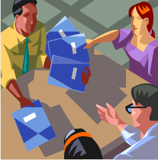
Resim 4: Rapor yazımı araştırmanın tamamlanmasıdır

Bilimsel araştırma çabasının son halkası yapılan araştırma sonucu elde edilen bulguların bir rapor haline getirilmesidir. Bu aşama araştırma süreci içerisinde elde edilen