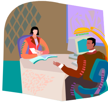
Resim 2: Görüşme bir veri toplama yöntemidir.

Görüşme: Bilgi alınacak kişilerle karřılıklı konuřma yoluyla veri toplama yöntemidir. Bu yöntemle veri toplamanın faydası bilgilerin birinci kaynaktan elde edilmesi ve arařtırmacıya daha geniř bilgi edinme imkanı sunmasıdır.