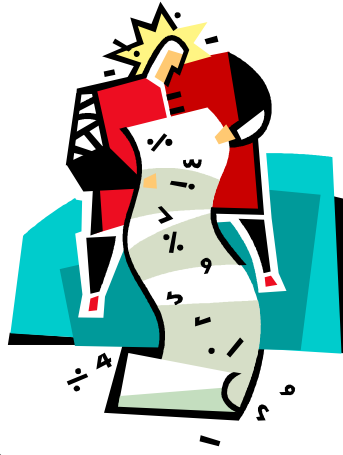
Resim 3: İstatistik sayısal verilerin analizidir

Araştırma sonucu çeşitli yöntemlerle elde edilen verilerin bir anlam ifade edebilmesi, bir hüküm bildirebilmesi için düzenlenmesi ve yorumlanması gerekir. Araştırmacının derlediği verilerin sayısı az ise yorumlanması kolay olacaktır. Fakat araştırmalarda az sayıda veri ile yetinmek genellemelere varmayı güçleştireceğinden araştırmanın geçerliliği açısından daha çok verinin toplanması gerekir. Veri sayısı arttıkça da verilerin yorumlanması güçleşecektir. Örneğin; bin kişiye uygulanan on soruluk bir anketin sonuçlarının belli bir analiz yöntemi kullanmadan değerlendirilmesi mümkün olmayacaktır. İşte bu amaçla bilimsel araştırmalarda verilerin yorumlanmasını sağlayacak yöntemlere ihtiyaç duyulur. Bu yöntemleri ise istatistik bilimi ele alır.