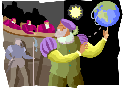
Resim 1: Galileo ve Engizisyon

Batının elinde şekillenen bilgi medeniyetine en genel anlamda pozitif bilim denmektedir. Pozitif bilimin kökleri doğal olarak çok eskilere dayansa da Avrupa da gelişimi Galileo ile başlatılabilir. Galileo yaptığı araştırmalarla insanlığa yeni ipuçları sunmuş ve dünya üzerinde çok ciddi değişimlere sebep olacak bilgi sürecini başlatmıştır. Galileo'nun bulunduğu eylemsizlik kuramı batıların tasavvur ettikleri evren anlayışını kökten değiştirmiş ve batıda ciddi bir zihinsel değişimin temellerini atmıştır. Eylemsizlik kavramıyla yola çıkan Galileo dünyanın dönebileceğini anlamış ve bunu bir iddia olarak ortaya atmıştır. O zamana kadar dünyayı evrenin en altında duran sabit bir yer olarak düşünen batılı zihniyeti bu bulguyla ciddi sarsıntılara maruz kalmış ve hatta bu büyük bilim adamını engizisyon mahkemelerinde yargılayarak idamını istemişlerdir. Galileo da baskılar karşısında geri adım atarak dünyanın döndüğü iddiasından vaz geçmiştir.