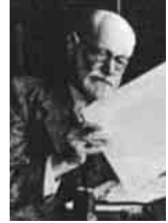
Sigmund Freud Psikoanalitik Kuramın kurucusu.

Süperego: Süperego toplumsal aktarımın ürünü olan ahlaki işlevlerin temsilcisidir. Ulaşılmak istenen idealleri, mükemmeli kapsar. Başlıca işlevi, davranışları, toplumun beklenti ve kuralları doğrultusunda kontrol etmektir. Bunu yaparken ceza (bireyin suçluluk duyması-vicdan-aşağılık duygularına kapılması) ya da ödül (gururlanma, kendini beğenip takdir etme-vicdan rahatlaması) kullanır.